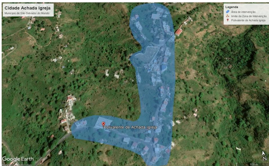
Figura 2 – Área de impacte do projeto, incluindo os povoados.